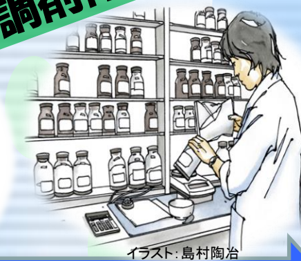
イラスト: 島村陶治